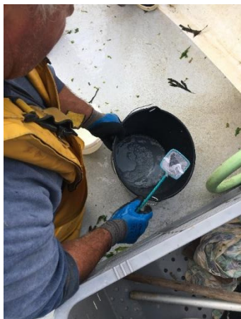
Fécondation artificielle des œufs de maigre menée à bord du bateau

En parallèle de ce projet, le Parc s'intéresse aux pratiques de la pêche de loisir du maigre et réalise un diagnostic sur les différentes techniques de pêche utilisées, leurs périodes et les zones d'utilisation, le nombre de pratiquants par secteurs géographiques et l'évaluation du nombre de captures.