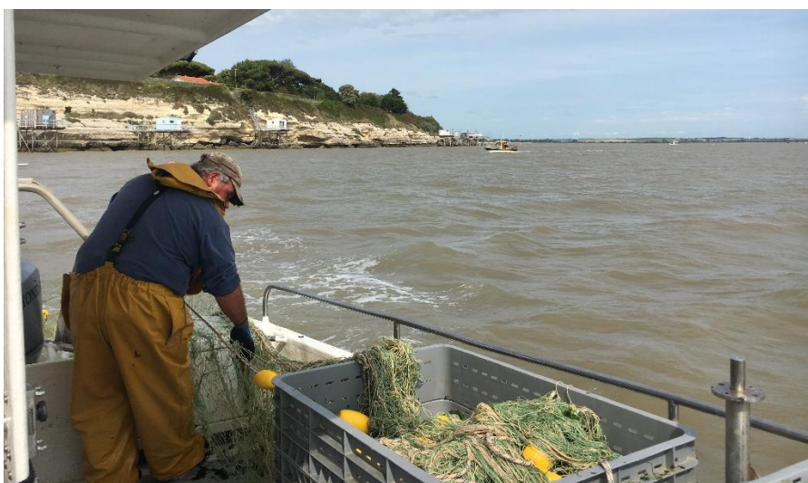
Pêche du maigre dans l'estuaire de la Gironde

Le maigre commun ( Argyrosomus regius ) est un poisson migrateur qui fréquente le golfe de Gascogne pour se diriger au printemps vers l'estuaire de la Gironde, la seule zone de reproduction connue en France. Les maigres reproducteurs se regroupent en grognant afin de frayer, à partir de fin mai jusqu'à début juillet. Ce poisson suscite un intérêt fort de la pêche maritime professionnelle et de loisir. L'enjeu pour le Parc naturel marin est de préserver cette ressource halieutique d'importance locale, en améliorant la connaissance et en impliquant les pêcheurs sur le respect de pratiques favorisant sa reproduction.